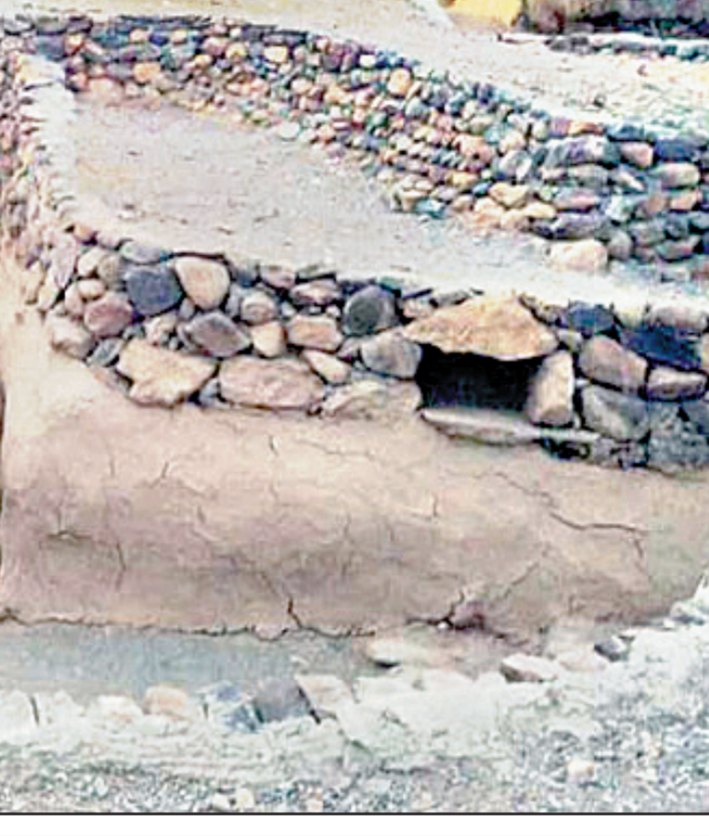
شهر تاریخی یزد

یزد سیاهه میراث جهانی جای گرفته است. با این رویداد فرخنده، مجال دیگری برای نگهداری از آثار ارزشمند ایران‌زمین، برای معرفی بیشتر فرهنگی و مدنی شهر است. مرمت و نگهداری این بجهان‌های فرهنگی وظیفه‌ای ملی است، چرا که مراکز تاریخی، شهرها، یادگانه‌گاه ابعاد اقتصادی، اجتماعی و فرهنگی مرمانی است که در دوره‌های تاریخی در این بخش از شهر روزگار سپری کرده و هویت فرهنگی آن را به ثبت رسانده‌اند.